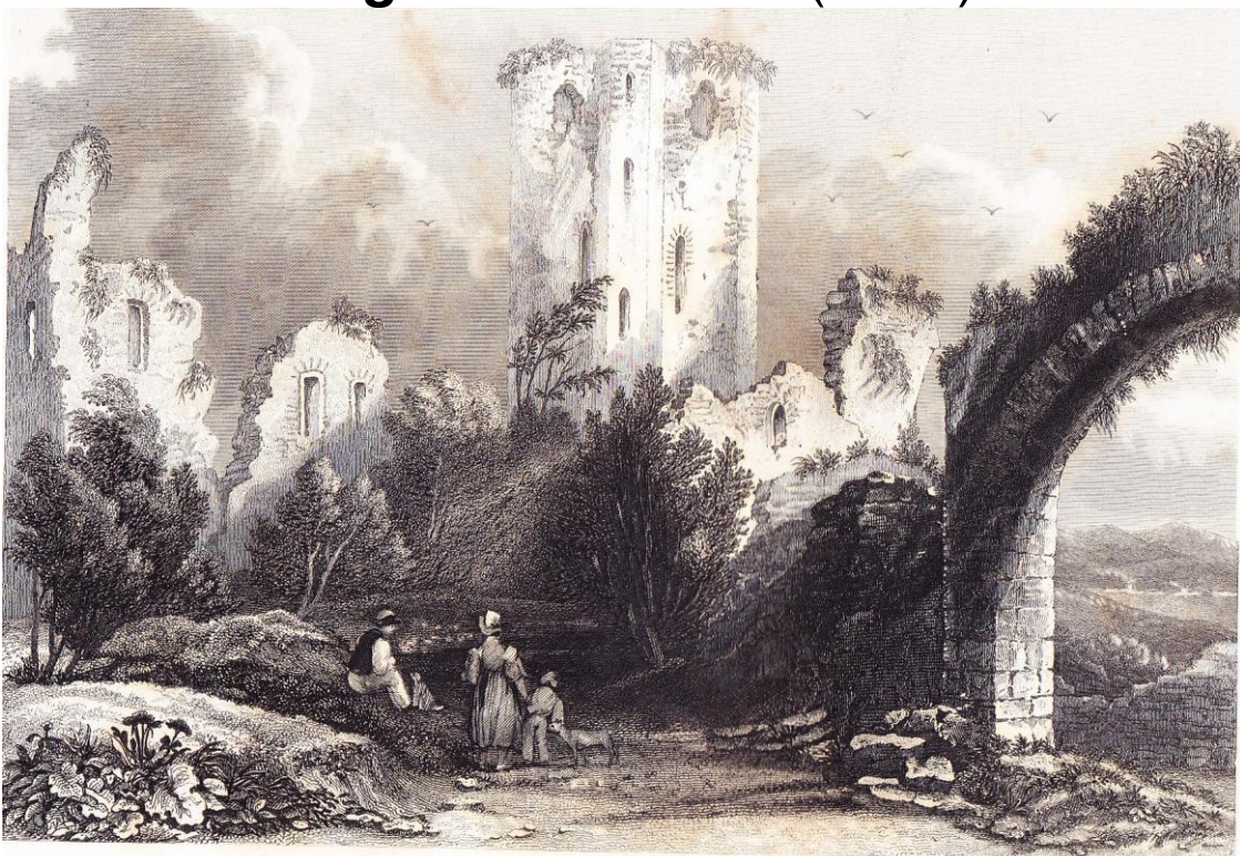
RUINS OF THE CASTLE OF NASSAU.

« Ruins of the Castle of Nassau – ruines du château de Nassau – Ruine das Schloss Nassau » (Allemagne), entre les pages 104 et 105 de Belgium & Nassau (1838)